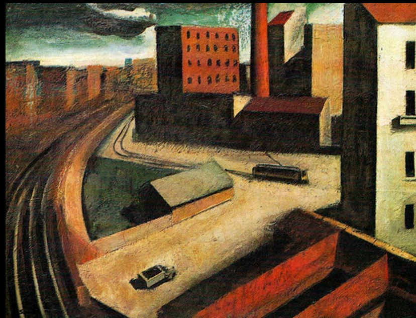
Mario Sironi Paesaggio urbano 1922 olio su tela collezione privata

Al fine di comprendere il maggior numero possibile di temi e problemi, la narrazione si svolge in termini essenzialmente diacronici, attraverso un percorso sviluppato su cinque moduli: