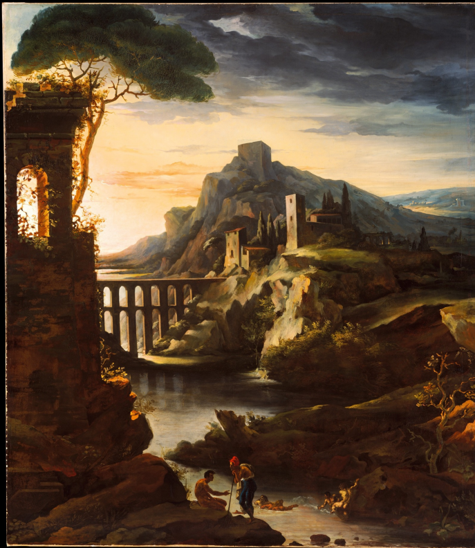
Théodore Géricault Paysage à l'aqueduc dit Le Soir 1818 olio su tela New York: The Met