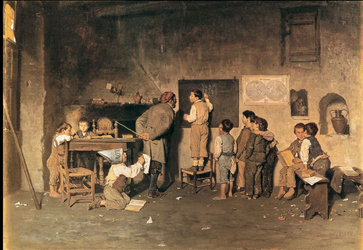
Giuseppe Costarini La scuola del villaggio 1870 ca. olio su tavola Firenze: Istituto Nazionale di Documentazione, Innovazione e Ricerca Educativa

Coloro che avranno frequentato con assiduità il corso e, pertanto, avranno portato a termine l'esercitazione in aula entro la fine del semestre d'insegnamento, ottenendo un voto sull'insieme dei risultati che varrà il 50% della valutazione finale, dovranno rispondere in forma orale a due domande, volte ad accertare la loro dimestichezza con i temi affrontati durante le lezioni.